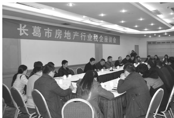
房地产行业税企座谈会

【加强税收管理】 一是加强税源管理，清理漏征漏管户。通过国地税共管户信息比对，将在国税局记录在案且未在地税局登记的纳税户进行登记，按管辖区域划分至每个中心所，再由中心所将登记任务划分到每个税收管理员，由税收管理员进行实地考察并登记在册，杜绝漏征漏管户。共清查达到起征点纳税人3185户，查补税款425万元。二是加强房产交易税收管理。进一步前置涉税审批权限，