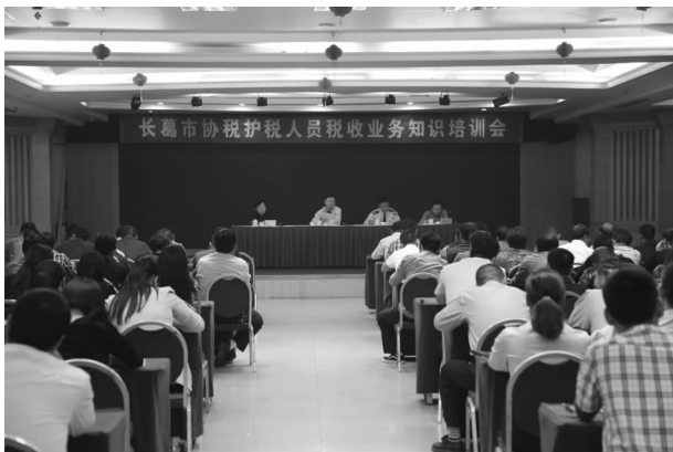
税收业务知识培训会

【财税征收】 细化目标任务，落实责任主体，实行责任追究；对乡镇收入分月排名，组织收入积极的乡镇办奖励财力。不断完善协税护税工作机制，