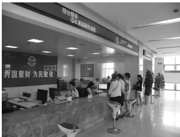
国税综合服务大厅

→科室扫描→落实核查→重点打击→公开宣传。基层分局主动公开数据,保证真实,科室分局上下联动坚持落实,稽查部门重点打击震慑,媒体宣传保持成效。将纳税评估工作列入目标管理考核,每月对基层分局进行通报,使纳税评估工作常态化,提高管理质量。同时加强日常督导,督促税管员及时将已评估入库的纳税户录入评估系统。