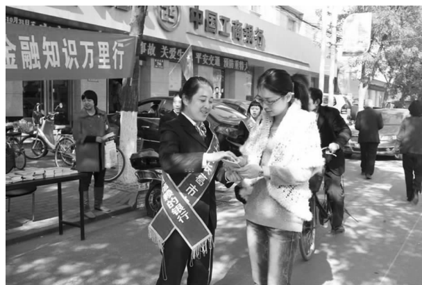
“金融知识万里行”宣传

【企业文化建设】 坚持以人为本理念，加强职工队伍建设。行党总支带头经常深入基层网点或员工家中，调查了解情况，慰问困难员工，坚持做到知民情、顺民意、解民忧。实行行务公开制，促进效益、节省开支，2013 年按照总行的财务核算办法，尽量减少各项费用的支出。