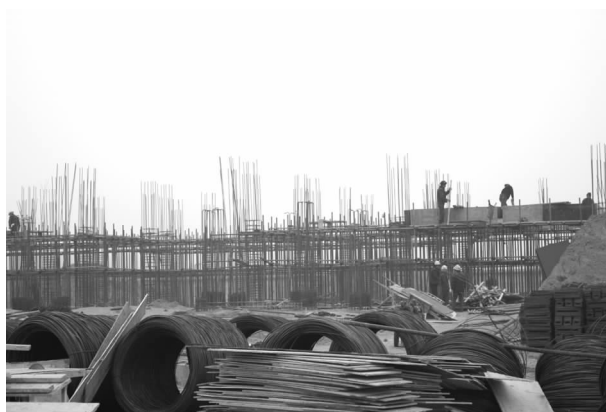
建设中的新气象服务中心

【站点搬迁】 10月底完成新址观测场仪器的布设，11月上旬通过省局对新址气象观测场建设情况的检查和验收工作，完成新址业务楼的招标和土地证办理工作，11月中旬已开工建设，业务楼主体地基完成浇注，钢筋架已搭至二层。12月中旬，获省局启用新址批复。12月下旬做好新址启用的各项准备工作。