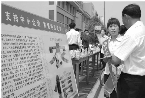
支持中小企业发展宣传

【金融服务】 一是牢固树立“以市场为导向、以客户为中心”的经营思想，坚持把开展贷款营销作为提升农信社核心竞争力和实现社农、社企“双赢”的最佳有效途径，不断拓宽思路，更新观念，积极探索新的贷款业务品种，改进贷款评估、审查、发放工作流程，建立限时服务制，努力构筑