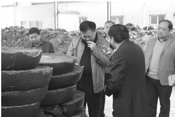
分行领导到企业调研

动方案，明确了活动的目标、工作安排的步骤；成立以行长为组长、副行长为副组长，部室主管为成员的活动领导小组，并由各部室合规联络员组成活动办公室。二是抓好活动开展。按照方案要求，认真发动员工，积极宣传动员，员工对活动的目的意