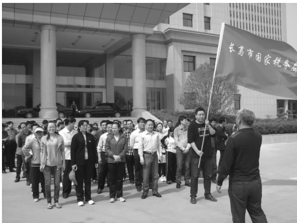
职工运动会开幕式

【队伍建设】 突出工作主题,明确目标方向。先后开展了“三抓一树”“三控三治促转型”“强管理、硬评估、狠督导、抓监督”“正风气、提能力、促养成”“关注节点、关注质量、关注规范”“固化流程、强化监督、简化考核、规化节约”“保收入保位次保稳定”“重打击强声势显效果”等主题活动,定期开展主题活动,简单就是力量,让大家知道重点干什么,并形成主题报告,效果明显。同时强化教育“点对点、面对面、点对点”培训,让大家知道怎么干。先后进行纳税评估及写作培训、税收法制建设、“五评法”讲解、风险企业分析、文明礼仪讲座、行业管理、税收宣传、怎样做人做事等专题培训。局机关学风日盛,作风崭新,部分工作人员还自发倡议成立了扫描俱乐部,利用业余时间相互交流心得提升技能。人财物向一线倾斜,把有限的资金用在提升大家的福利上,共