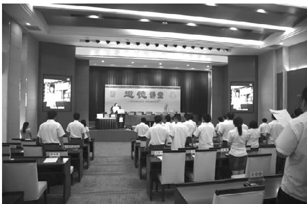
电力职业道德讲堂

【企业文化】 2013年不断强化“诚信、责任、创新、奉献”核心价值观宣传教育，积极实施企业文化传播工程、落地工程和评价工程，建立创先争优长效机制，全面落实企业文化“五统一”要求，积极推进企业文化建设“三大工程”。广泛开展干部培训、技术比武、全员普考、专业调考等活动，大力推进“双师型”人才队伍建设。持续开展“道德之星”评选活动，借助“道德讲堂”活动平台，大力宣传先进典型事迹，进一步树立员工积极向上、奋发为企的良好形象。大力推进班组建设，完善班组建设管理办法和考核细则，公司两个“六型一化”标杆班组和15个国网达标班组已顺利通过省公司验收。