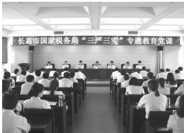
“三严三实”专题教育党课

【税收收入】 全局组织国税收入 102788 万元，同比增长 11.25%，增收 10396 万元；其中组织全市本级收入 30010 万元，同比增长 15.35%，增收 3995 万元，完成地方政府年计划的 100.01%，圆满完成全年收入目标。