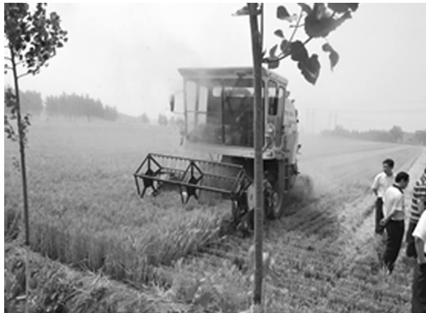
小麦联合收割机田间作业

【粮食生产】 以粮食高产创建为抓手，以“万名科技人员包村服务粮食生产行动”、“基层农技推广体系改革与建设补助项目”和“测土配方施肥项目”为载体，大力推广先进、实用的现代农业新技术，积极应对春季低温少雨、夏秋持续高温干旱等不利因素，全面落实抗灾保丰收措施，全市粮食生产再获丰收，总产达 53.8 万吨，其中夏粮 28.2 万吨，秋粮 25.6 万吨。