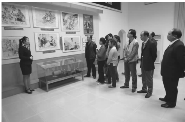
参观杨水才纪念馆

【和谐建设】 坚持在市分行督导组正确领导下，按照活动方案抓好落实。一是学习教育成果好。坚持每周二下午组织全体员工集中学习，共计学习18次，达到9天时间，参观1个教育基地，组织1次知识测试，观看两次教育影片，召开2次讨论会，行领导集中上党课3次。二是征求意见有针对。经过梳理，班子征求意见建议涉及“四风”方面11条，分别是形式主义方面4条，官僚主义方面3条，奢靡之风方面3条，享乐主义方面建议1条；立行立改3条。三是查摆问题务求实效。支