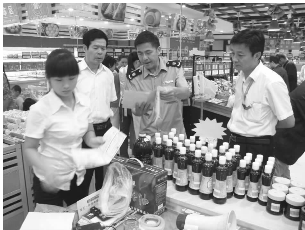
省局领导视察蜂产品质检中心建设情况

质检中心大楼（长葛市质检大厦）2014 年已完成封顶及二次结构，即将进行主体验收和内外粉刷，预计 2015 年底申请验收并投入使用。