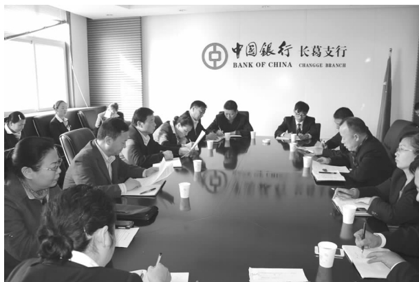
党的群众路线教育实践活动

【党的群众路线教育实践活动】 2014 年，积极开展群众路线教育实践活动。根据上级行工作部署，先后经过学习教育、听取意见，查摆问题、开展批评，整改落实、建章立制三个阶段，做到有特色、有做法、有成效。