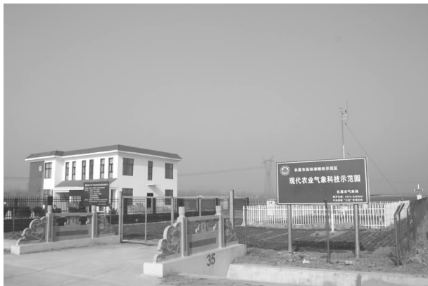
石象镇农田小气候观测站和气象科技示范园

分站，升级改造了古桥气象科技示园，在气象灾害易发乡镇安装了7部气象信息播报户外显示屏。