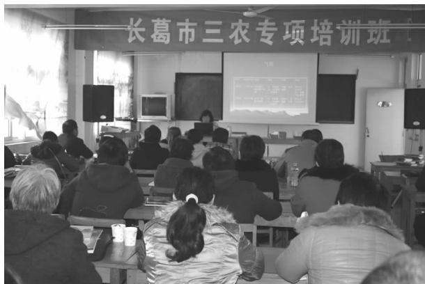
三农专项气象培训班

年内，市政府出台《加强气象为农服务体系建设实施意见》文件，成立由主管副市长为组长，气象、农业、民政等多家单位为成员的“三农”气象服务专项建设工作领导小组，为长葛市农业气象服务体系和农村气象灾害防御体系建设以及三农专项工作的顺利实施提供了政策支持。该局应势而为，举办了三农专项气象服务培训班，培训气象信息员、农业技术推广人员 400 余人；完成了《长葛市冬小麦干旱灾害风险区划》，印刷《现代农业气象服务手册—小麦、玉米、蔬菜》《农村气象灾害防御手册》《气象信息员手册》等各类宣传图册 30000 多本。