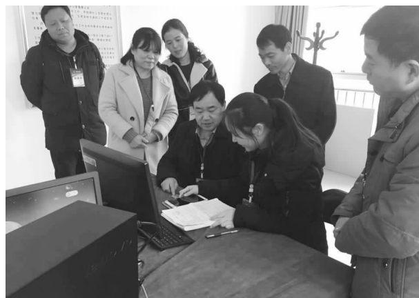
市农普办领导在调研第三次全国农业普查PDA现场登记工作

【第三次全国农业普查】 2016年是第三次全国农业普查数据采集关键之年,作为普查工作的牵头部门,坚持依法普查,健全普查机制、严格执行普查方案,扎实开展普查试点、普查宣传、业务培训,确保三农普工作圆满完成。一是健全领导机制落实责任。成立了以常务副市长为组长的领导小组。全面安排部署了全市三农普工作;并将“第三次全国农业普查工作”纳入2016年政府重点工