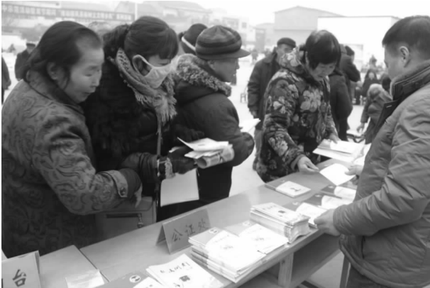
法制文化进社区普法教育活动

法院、检察院和公安机关的沟通,做好社区矫正人员的衔接工作,定期与公安机关、检察院对社区服刑人员的人数和相关信息进行核查比对,有效提高矫正质量。积极筹备长葛市社区矫正中心建设工作。