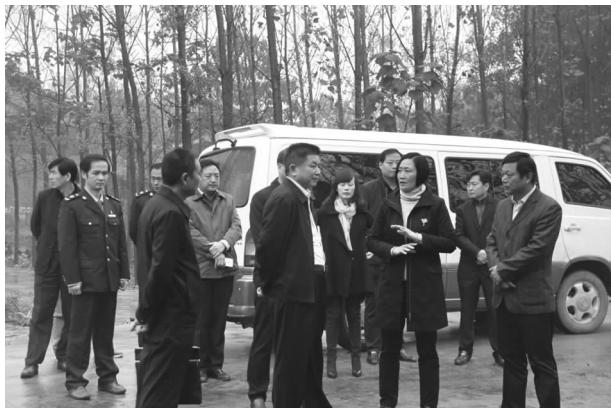
国家工商总局消保局副局长李军一行来许督导推进线上线下一体化监管工作

【网络市场监管】 8月26日,国家工商总局消保局副局长李军一行来许督导推进线上线下一体化监管,深入开展2016网络市场监督专项行动。总局消保局王琦副处长、省工商局赵中祥副局长、网监处蒋锡林处长、消保处翟小铁处长和市局蔚钟声局长、王永祥副局长等陪同督查。在长葛市,督查组一行实地走访了河南鲜易网络科技有限公司,查看了该公司鲜易网电商平台。对企业的鲜易网电商平台模式、首家B2B+O2O的服务模式以及通过此种模式形成的良性电商发展生态圈给予了充分地肯定和高度评价。