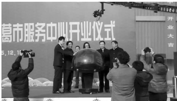
阿里巴巴农村淘宝服务中心开业

源对接, 加快推动电子商务进农村深入实施。农村淘宝自上年 12 月份正式落地以来, 持续加强与阿里、京东平台的对接力度, 着力提升合伙人业务素质。全年开展网商培训 180 次, 培训人员突破 1.5 万人次, 全市村淘合伙人达到 61 人, 覆盖全市 100% 的行政乡镇。阿里旺农贷项目顺利落地, 农村淘宝服务站成为“网商银行”, 为种养殖大户累计发放贷款 157 万元。2016 年, 农村电商新增网店 200 多家, 带动就业人员 7500 人, 年交易额达 6 亿多元。全市农村电商运营健康维度(含收入、服务村民数、无线段运营等)连续 6 个月位列阿里农村电商中西部 9 省大区第 1 名。在河南省共评选出的 13 个“淘宝村”, 全市入围 4 个, 数量居全省第 1 名。全市先后被评为农产品网上销售全国百佳县, 河南省电子商务进农村综合示范县(市)。“双 11”当天, 长葛村淘服务站完成订单 0.85 万单, 成交金额 147 万元, 并成功连线天猫直播主会场, 全市农村电商村级服务站成为全球 300 多家媒体关注焦点, 农村电商迈出国际化市场第一步。