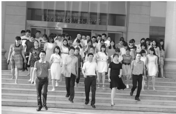
团结进取的审计队伍

【机关管理】 一是坚持用制度管人，用制度管事，切实维护良好信誉和审计形象。结合审计事业发展和工作实际，在原有的管理基础上，对工作制度作了进一步完善和补充。进一步完善财务管理制度，重大经费开支集体研究决定，严格执行开支审批程序，实行民主理财和财务公开。在政务公开和政务服务平台上将群众普遍关心、涉及切身利益的热点问题和“人、财、物、事”等“三重一大”事项管理的相关内容及时向社会公布，接受群众监