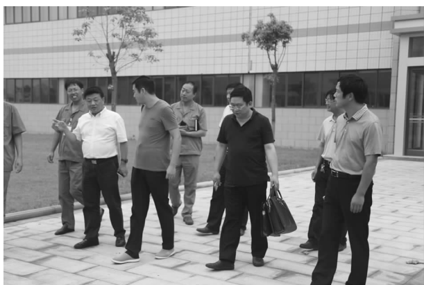
省计量科学研究院院长王晓伟到长葛市调研计量工作

案的工作，共检定计量器具 4600 台，医疗卫生在用器具 271 台。三是开展“计量惠民生诚信促和谐”专项行动，在全市范围内推荐推进诚信计量体系建设。