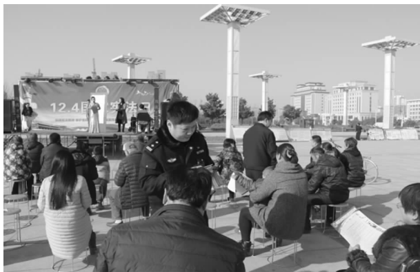
法治宣传教育活动

【法治宣传教育】 创新形式，加大普法教育宣传力度。建立健全了各级党政机关领导干部学习宪法制度，把宪法学习纳为党委（党组）理论学习中心组学习内容。充分利用长葛市“学法用法微信公共平台”和“长葛市法治宣传手机报”，通过“案例解析”“新法速递”等形式定时传送法治教育图片和文件资料及时更新普法宣传教育动态，大大提高了法治宣传的覆盖面。共发送手机报 51 期，累计发送信息 2.86 万条，接收人数达 10.46 万余人，微信公共平台在线人数 1 万余人。服务群众，积极开展社会治安综合治理、平安建设宣传活动和“律师近百企”“送法下乡”等系列法律服务活动。坚持把平安创建、综治和法治宣传工作有机融合，拓宽宣传渠道，突出广度和深度，全市各镇（办）司法所、法律服务所、律师所积极参与，共设立咨询台 30 余次，发放宣传资料 5 万份，解答法律咨询 3000 条。对“六五”普法工作进行了认真总结，在新的起点上对“七五”法治宣传教育规划进行了科学谋划。